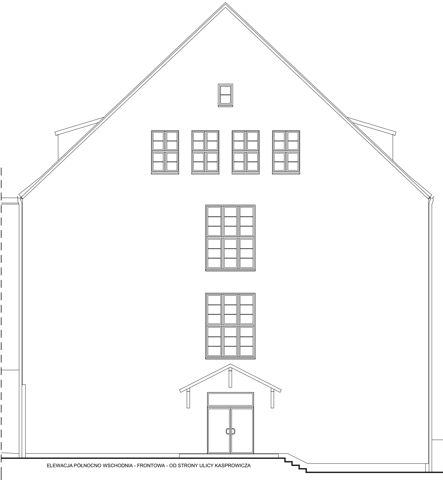
ELEWACJA PÓŁNOCNO WSCHODNIA - FRONTOWA - OD STRONY ULICY KASPROWICZA